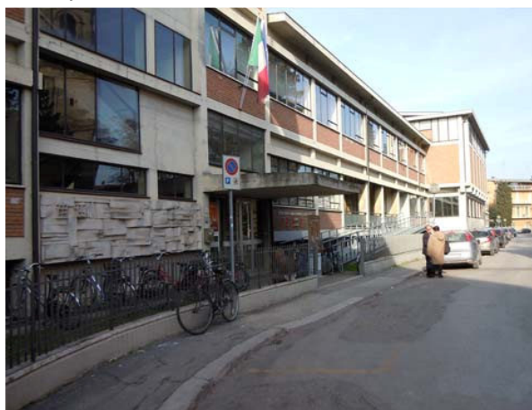
Vista dell'Istituto Tecnico Oriani, ove è collocata l'opera