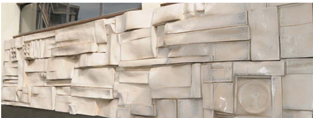
Veduta generale dell'opera