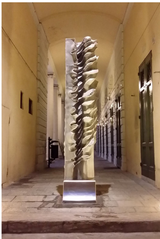
Immagine dell'opera sotto il voltone del Teatro