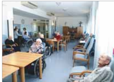
Una sala ritrovo delle Residenze Il Fontanone.

Fortunatamente non siamo di fronte a rischi ambientali come quelli campani, ma verrà il giorno in cui la discarica di Imola, dove vengono attualmente conferiti i nostri rifiuti, sarà esaurita e si dovrà procedere a realizzarne una nuova, sottraendo altre aree verdi e incontaminate al territorio, creando inoltre disagi e tensioni nella popolazione, senza dimenticare gli obiettivi imposti da ATO che prevedono percentuali di differenziata al 50% nel 2009 e al 60% nel 2012. In questa ottica il Gruppo Consiliare Verdi ha presentato lo scorso novembre una mozione (approvata da tutto il Consiglio Comunale) che obbliga l'Amministrazione