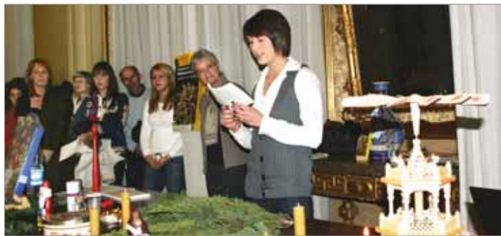
Un'alunna del liceo di Santa Umiltà mentre descrive il Natale tedesco durante la serata (Foto Renato Avato - Ass. Gemellaggi).

Una decina di studenti dello stesso liceo manfredo sarà infine ospitata nelle famiglie di studenti della Schillerrealschule di Schwäbisch Gmünd nella terza settimana di luglio. Sempre in ambito scolastico, va segnalato che il Comune di Faenza ha aderito al "Progetto Scuola Xenia" (scambio di studenti di età compresa tra i 19 e i 25 anni) proposto dalla città gemella di Amaroussion (Grecia) all'Unione Europea.