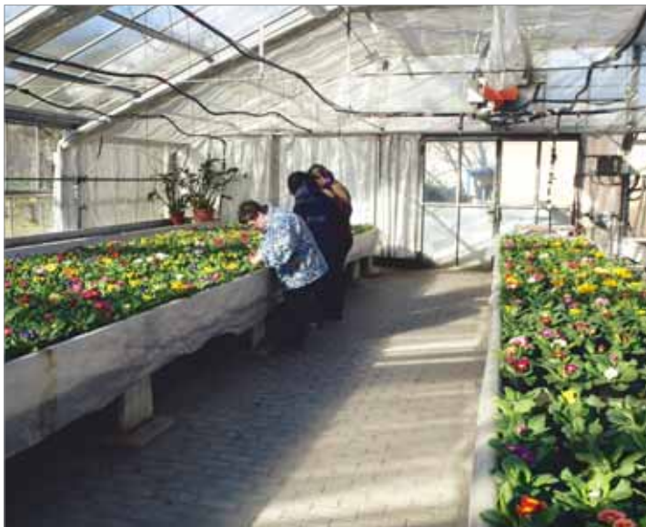
Centro Socio-riabilitativo La Serra.

Nel PEEP Cappuccini sono dieci anni che tra appalti, subappalti, fallimenti dei subappaltanti, casini vari, continua tra mille problemi la costruzione della nuova scuola Don Milani, fiore all'occhiello delle varie Amministrazioni,