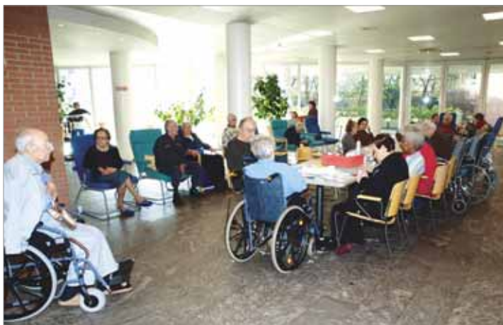
Centro diurno S. Umiltà: sala incontri.

I giovani immigrati vengono inseriti nelle classi anche a metà dell'anno scolastico senza aver prima imparato le nozioni di base come la lingua italiana, così che non possono seguire le normali attività didattiche, provocando di conseguenza un rallentamento del programma scolastico che spesso non viene completato a danno dei nostri ragazzi e degli stessi ragazzi stranieri che con problemi di partecipazione e