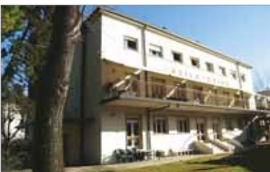
Esterno della Casa del Sole.

Siamo milioni di lavoratori e di lavoratrici... c'è il lavoro dei call center, del-