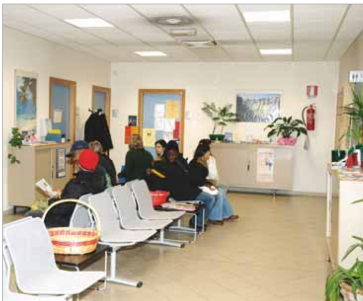
La sala d'attesa dell'ambulatorio AUSL di via Zaccagni.

Sul piano gestionale l'integrazione si realizza attraverso l'interazione dei soggetti istituzionali presenti in ambito distrettuale e preposti alla gestione delle risorse per l'erogazione delle prestazioni e degli interventi (i servizi sociali dei Comuni di Faenza, Brisighella, Casola Valsenio, Castel Bolognese, Riolo Terme, Solarolo e Azienda Ausl), che si coordinano per realizzare l'unicità gestionale dei fattori produttivi e delle risorse e che assicurano la costituzione e la regolazione del fun-