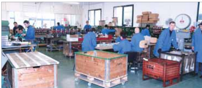
Interno di un laboratorio Ceff.

2) la Lotta di Liberazione oltre a pagine di eroismo e coraggio, fece registrare anche azioni inutili che riversarono sui civili (con le cosiddette rappresaglie) i loro effetti negativi: l'esempio più noto credo sia l'attentato di via Rasella che