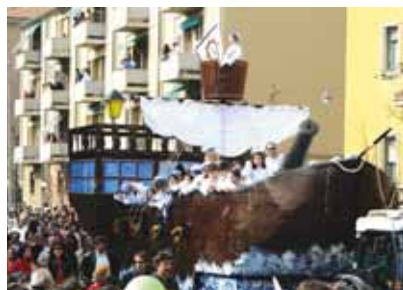
Due momenti della festa di San Lazzaro 2007. Il Carnevale 2008 è in programma domenica 9 marzo.

Il nostro ruolo, istituzionale ed elettivo, non ci esime da raccogliere rimostranze da parte dei cittadini per quanto riguarda: viabilità, attività sociali, attività culturali, problemi legati al degrado ambientale, e tutti quegli aspetti piccoli e grandi che possono essere vissuti da parte del cittadino come un problema di comunità.