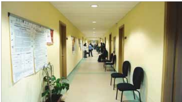
Interno della sede dei Servizi Sociali Associati (Via degli Inforti).