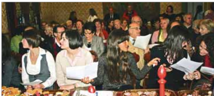
Grande partecipazione di pubblico alla serata del 5 dicembre 2007 dedicata dall'Associazione Gemellaggi alla città gemella di Schwäbisch Gmünd. Sulla a e sulla u del nome della città va posta la dieresi.

La scuola faentina, ospite in Germania lo scorso ottobre, ospiterà a sua volta una delegazione di studenti di Schwäbisch Gmünd dal 18 al 25 aprile prossimo. Sempre in aprile, dal 7 all'11, saranno invece 72 studenti della scuola media Lanzoni a recarsi nella città tedesca, preceduti dal 31 marzo al 4 aprile da 30 studenti della media Bendandi in visita invece a Gmunden (Austria). Un'altra visita a Schwäbisch Gmünd è