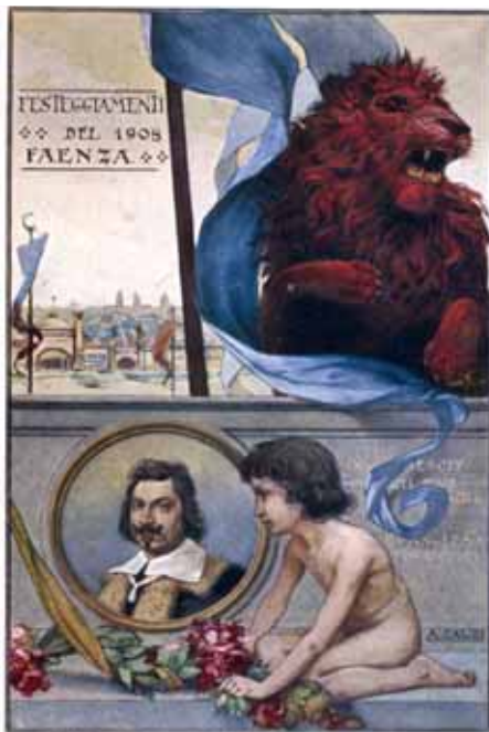
Una cartolina celebrativa dell'Expò del 1908.

La prima conferenza, dal titolo L'Esposizione faentina del 1908 e la Romagna di inizio secolo, è stata tenuta il 12 dicembre 2007 dal prof. Roberto Balzani dell'Università degli Studi di Bologna, fine conoscitore delle vicende romagnole degli ultimi due secoli.