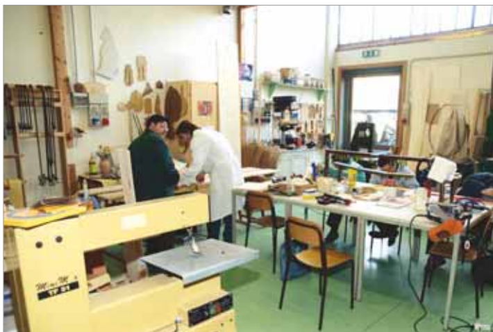
Un laboratorio del Centro Socio-riabilitativo La Lampada di Aladino.

Nulla di tutto ciò, la logica del servizio al paese ed ai cittadini è da tempo irrimediabile nelle azioni e nei ragionamen-