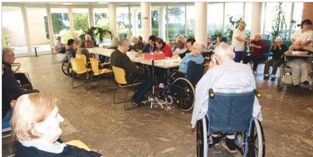
Sala ritrovo del centro diurno S. Umiltà.

La complessità assistenziale delle persone affette da demenza rende necessario attivare interventi a sostegno, sia del nucleo, sia della persona, pertanto nel programma attuativo dei Piani di Zona il Servizio Anziani dei Servizi Sociali Associati del Comune di Faenza ha attivato il progetto “Il Mulino della Memoria”. Si tratta di un progetto sperimentale di assisten-