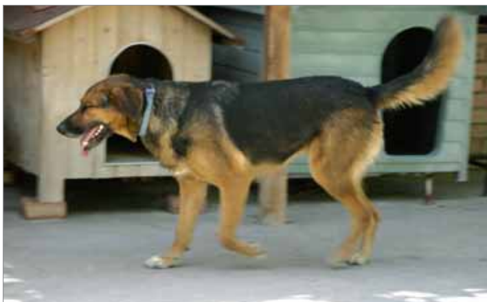
Lara, uno dei circa centocinquanta ospiti dell'Enpa di Faenza.

persone unite da un forte amore per gli animali. Infine, nell'ambito dell'annuale Festa delle Associazioni, in collaborazione con le guardie ecologiche volontarie, si organizza il "Bastard'inBici", simpatica bicicletata dal parco Calamelli al Rifugio del Cane (via Righi), che regala a tutti i partecipanti una merenda coi fiocchi. Tutto ciò è reso possibile grazie al contributo dei tanti faentini che ci seguono: una testimonianza d'amore verso gli animali che, in tema di abbandoni, risulta in netta controtendenza rispetto ai dati nazionali!