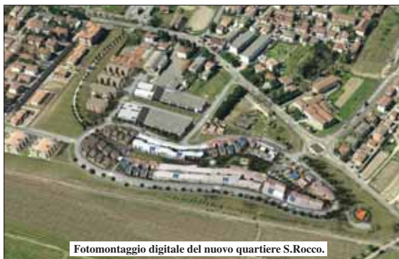
Fotomontaggio digitale del nuovo quartiere S.Rocco.

Ma quello che deve colpire maggiormente è la loro collocazione in luoghi già pronti per essere vissuti e completi di tutti i servizi.