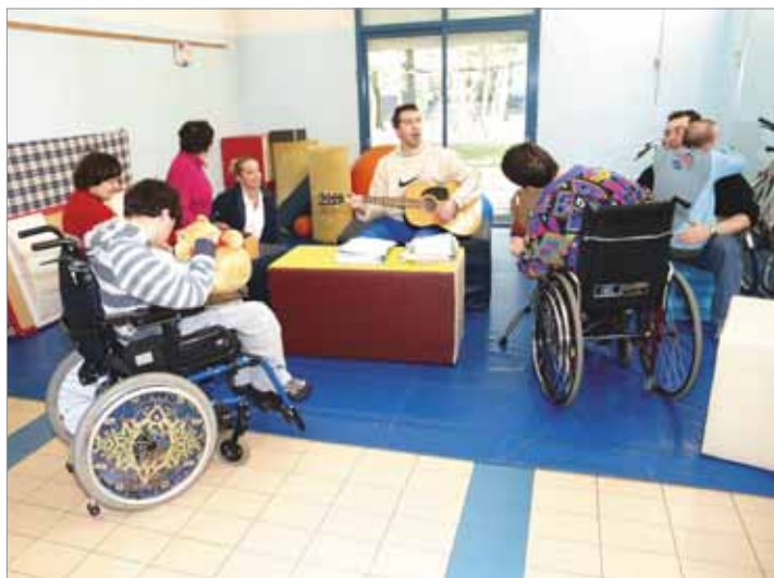
Momento musicale al Centro La Rondine.