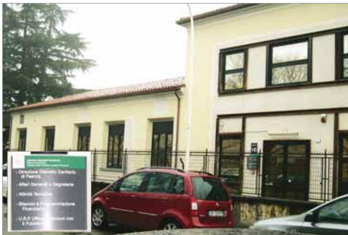
Esterno della sede del Distretto Sanitario di Faenza (Archivio AUSL Ravenna).

Nell'ambito dell'organizzazione dei servizi, l'attuazione dell'integrazione socio-sanitaria comporta il passaggio decisivo da un sistema di offerta basato sulle professionalità specialistiche ad un sistema di offerta caratterizzato dall'accompagnamento e dalla presa in cura con continuità della persona. Questo secondo approccio promuove l'autonomia, la consapevolezza e la responsabilità attraverso la partecipazione, e si propone di valorizzare le professionalità specialistiche portandole ad interagire e a confrontarsi con l'unitarietà del soggetto-utente, rispetto alla quale possono trovare una ragione ancora più elevata e profonda circa il valore del proprio lavoro specifico. L'attuazione dell'integrazione è voluta soprattutto in quanto funzionale al migliore soddisfacimento dei biso-