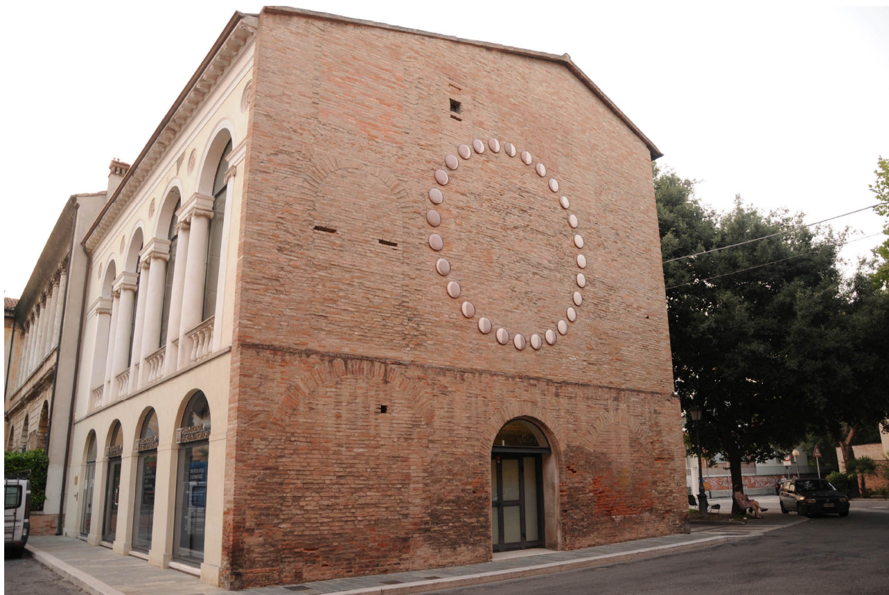
Vista da Piazza 2 Giugno