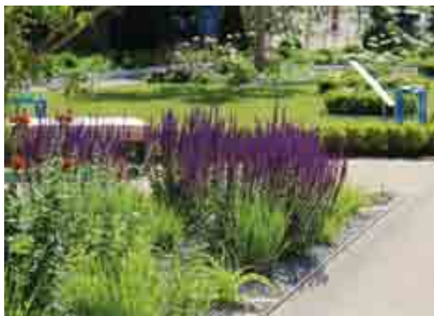
Due particolari del giardino.