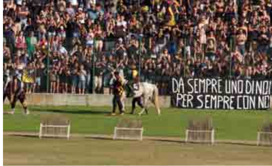
Il cavaliere del Rione Nero e il suo pubblico.

Questo non solo per attrarre visitatori durante il mese di giugno, ma soprattutto per far percepire a livello nazionale il grande valore che ha il nostro Palio, potendo così attrarre sovvenzioni e contributi sovra-comunali, elemento che ci permetterebbe, anche in un periodo di limitate risorse economiche, di far crescere nel modo migliore i rioni e la manifestazione.