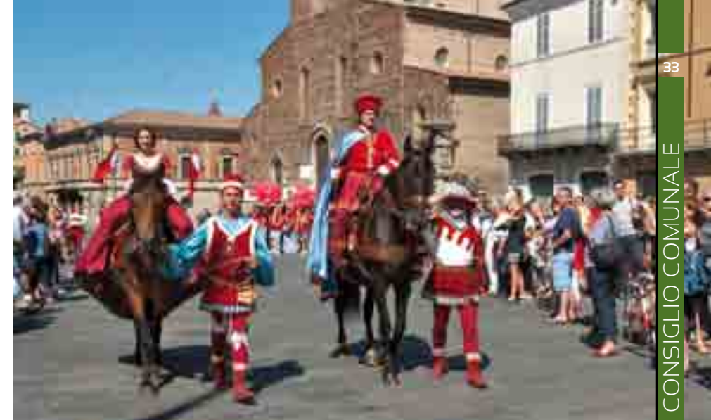
Un momento della sfilata del Rione Rosso.

Dalle politiche della gestione degli zingari ci sono due assenti, prima di tutto i cittadini e poi gli assistiti partecipi ignari di un fiume di inutili progetti. Tutti i provvedimenti passano sulle loro teste e sulle nostre teste. Il terzo settore (le onlus e altro), la Caritas e le sue emanazioni dovrebbero regolarmente presentare una rendicontazione di quello che gestiscono. Pertanto chiediamo un bilancio certificato, trasparente, invece dell'attuale autoreferenzialità. Da sempre il sindaco Malpezzi ignora la partecipazione e i bilanci certificati.