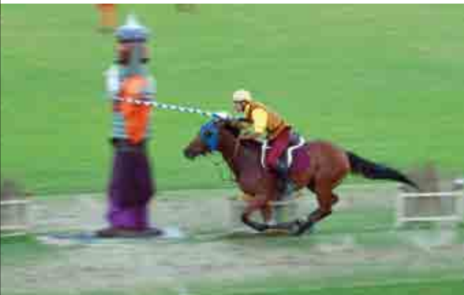
il cavaliere del Rione Giallo.