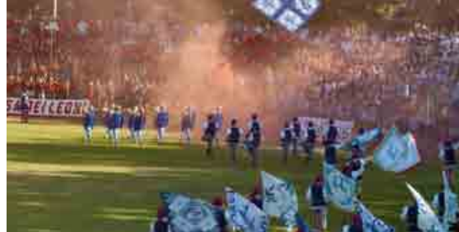
Clarine, tamburini e pubblico del Rione Borgo Durbecco.

Questo è quello che vedrà tutta la città ed i forestieri che vengono richia-