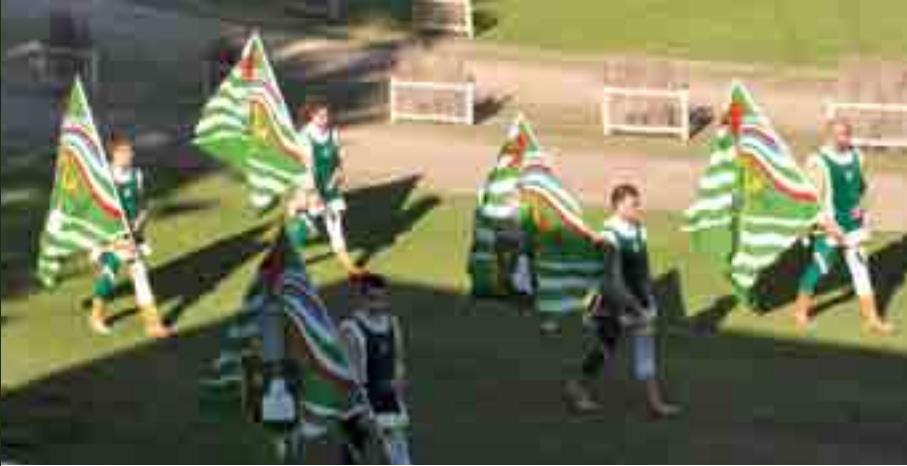
Alfieri bandieranti del Rione Verde.