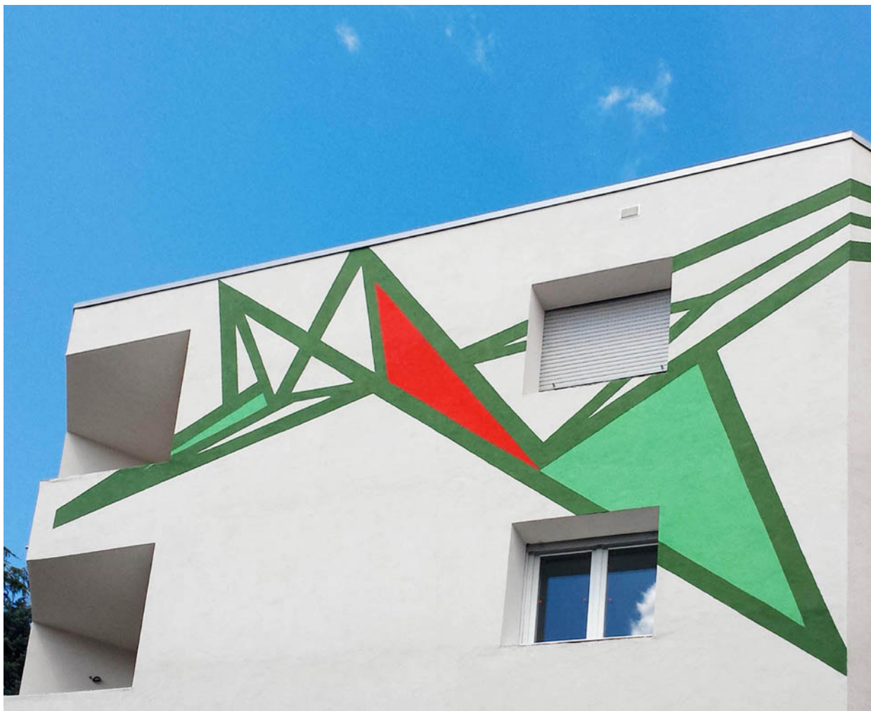
Particolare della facciata