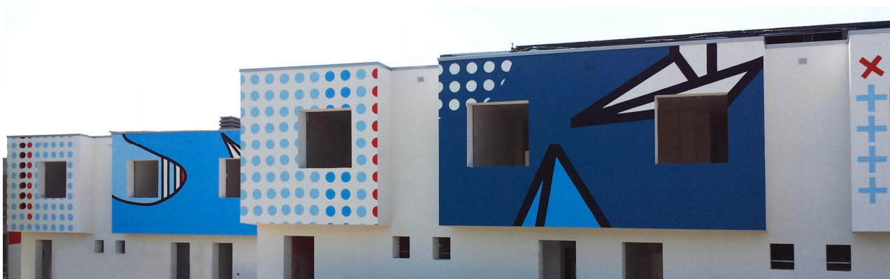
Sviluppo relativo al blocco 2