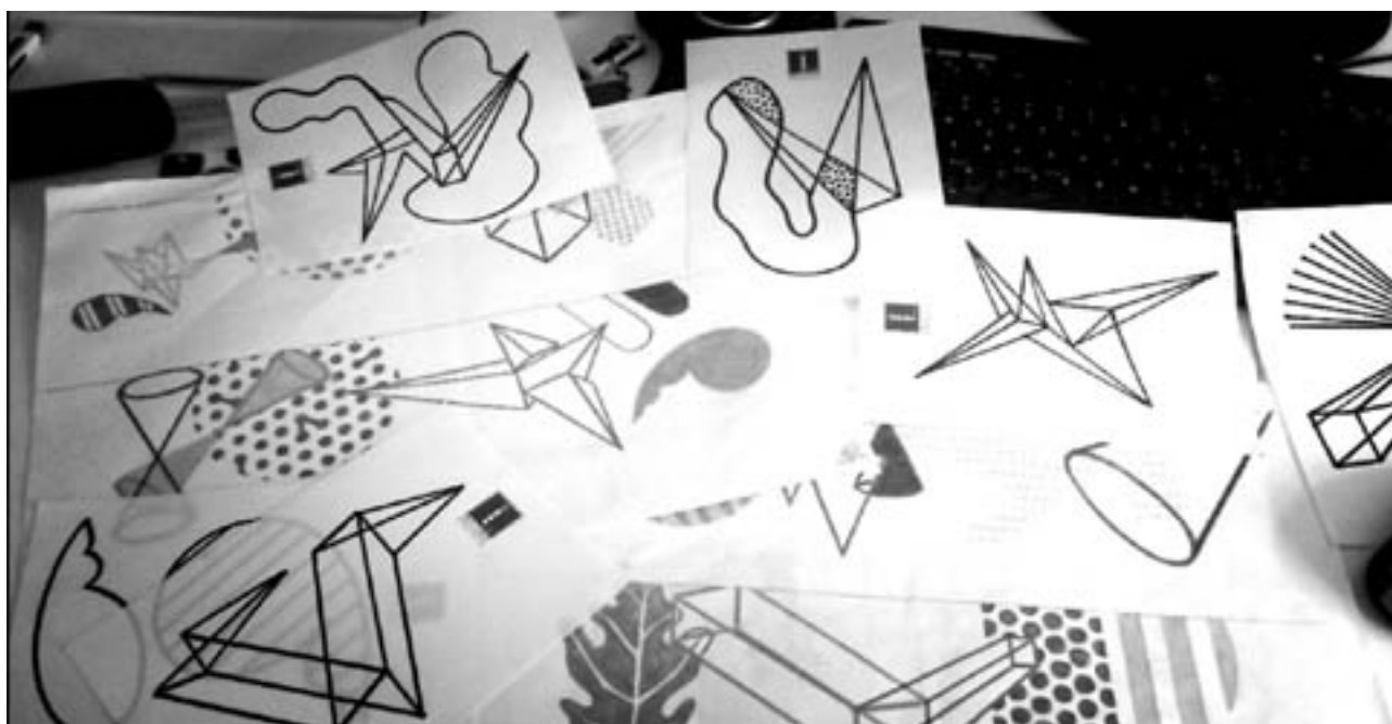
Bozzetti del progetto