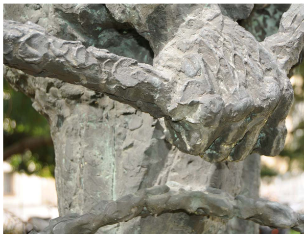
Particolare delle mani