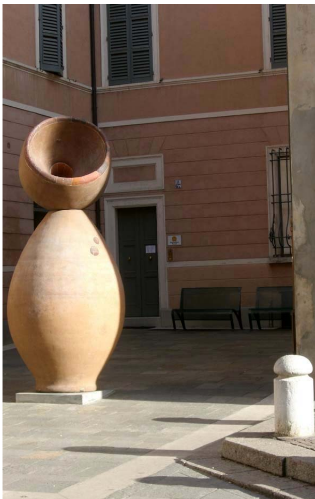
Immagine dell'opera presso la chiesa del Suffragio