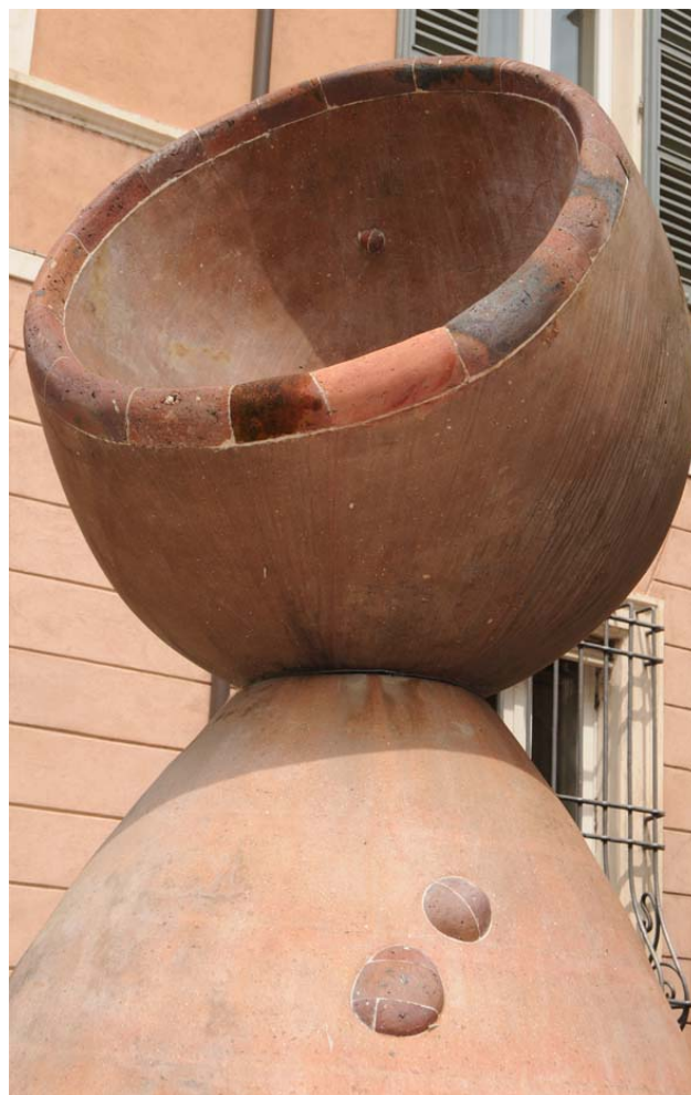
Immagine della semisfera